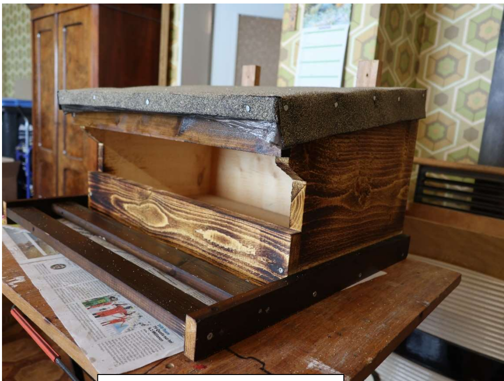
Der fertige Nistkasten

Breite 31 cm: Länge 160 & 110 cm Breite 33 cm: Länge 110 cm Breite 45 cm: Länge 128 cm Breite 10 cm: Länge 120 cm Breite 6 cm: Länge 180 cm Breite 5 cm: Länge 220 cm